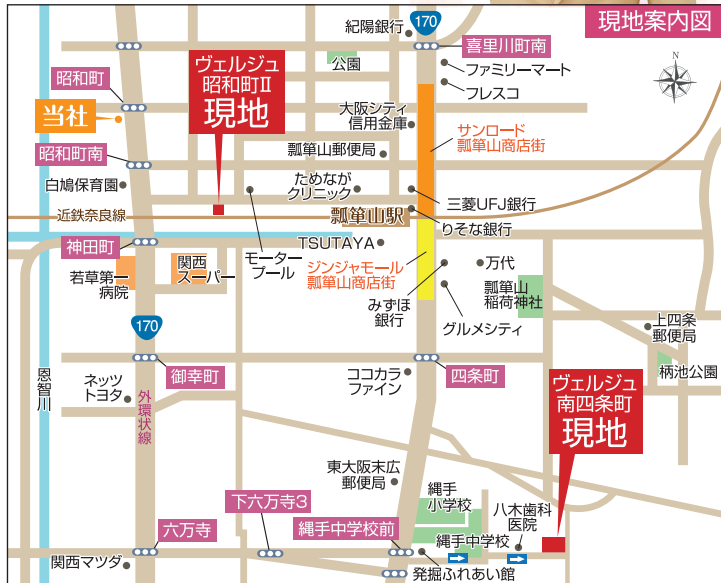
【ヴェルジュ南四条町 分譲概要】●所在地/東大阪市南四条町8番街区●交通/近鉄奈良線「瓢箪山」駅徒歩11分●総区画数/全4区画●土地・建物セット価格(消費税・外構費含)/2,980万円(A号地)~●敷地面積/約100.29㎡(約30.34坪)~●延床面積/約100.44㎡(約30.38坪)~●自由設計●私道負担/別途有●地目/宅地●道路幅員/公道:東側約5m南側約4m●構造/木造2階建●設備/関西電力・都市ガス・公営水道・公共下水●用途地域/第1種住居地域(準防火地域)●建ぺい率/60%●容積率/200%●取引態様/媒介